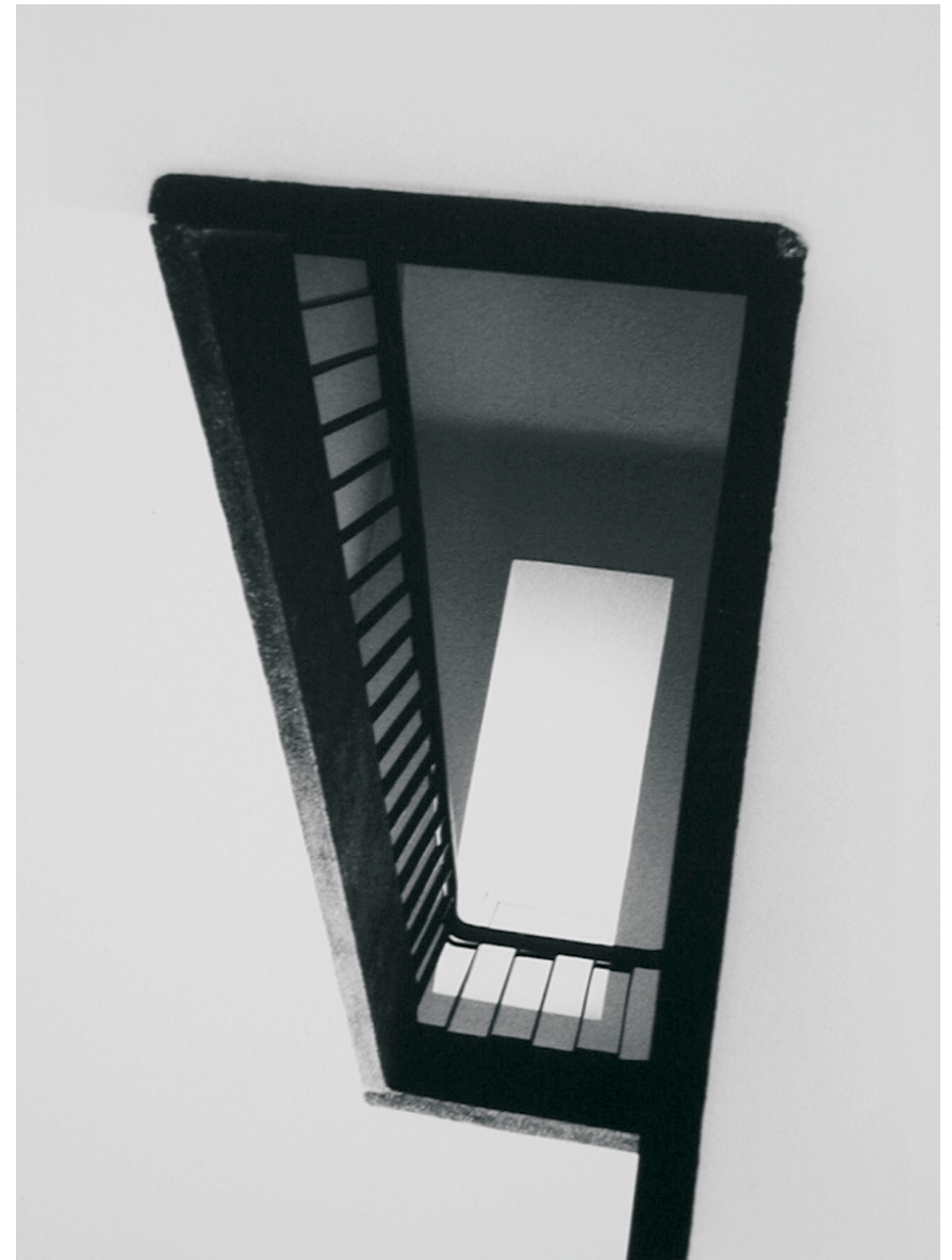
Renata Bojadzudis Vorklasse Fotografie