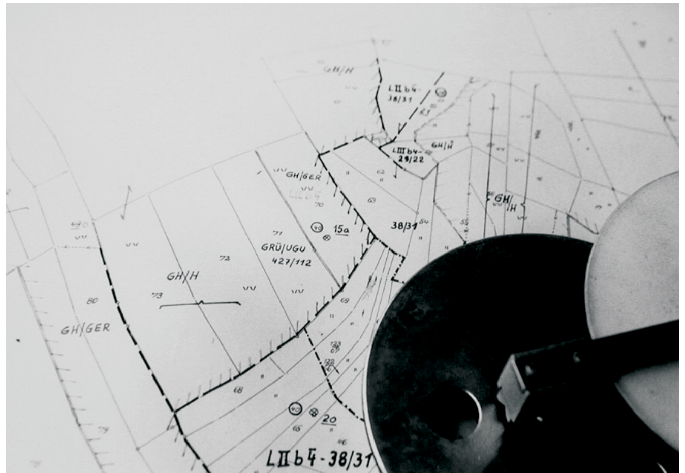
Renata Bojadzudis Vorklasse Fotografie